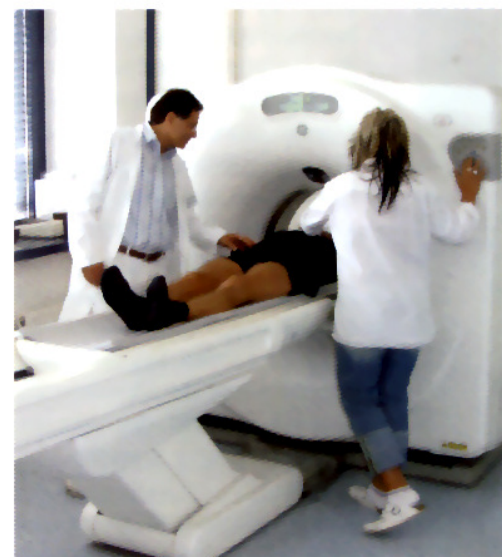
Fällt das MRT nur eine einzige Stunde aus, kostet das die fünf Praxisinhaber 600 Euro.